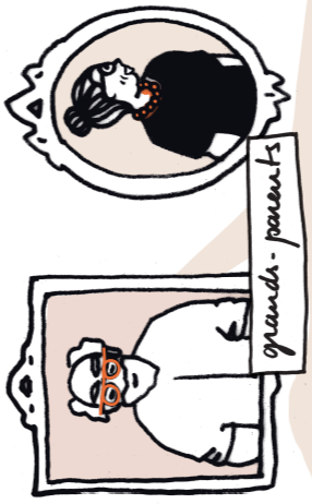
grands - parents